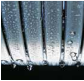
Inox-Radial-Wärmetauscher – langlebig und effizient