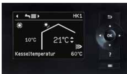
Display der Regelung Vitotronic 200