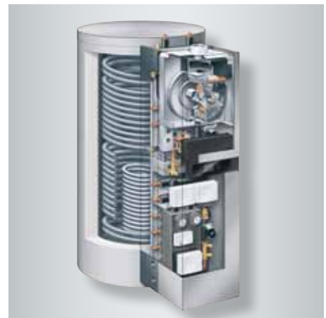
Vitosolar 300-F mit Öl-Brennwert-Wandgerät Vitoladens 300-W

In der Kombination mit einem Öl- oder Gas-Brennwert-Wandgerät arbeitet Vitosolar 300-F äußerst emissionsarm. Durch den Anschluss eines Festbrennstoffkessels für Holz oder Pellets ist der CO 2 -neutrale Betrieb zum nachhaltigen Klimaschutz möglich. Das Wandgerät hat dann die Funktion eines Spitzenlastkessels zur Erwärmung von Heiz- und Trinkwasser.