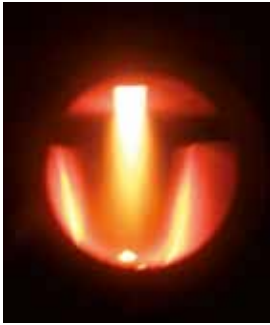
Vergasertechnik beim Vitoligno 100-S

Der Scheitholz-Vergaserkessel Vitoligno 100-S ist ein idealer Beistellkessel zur vorhandenen Öl- oder Gasheizung. Im bivalenten Einsatz liefert er zuverlässig Heizwärme und Warmwasser.