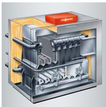
Mit einer Nenn-Wärmeleistung von 72 bis 144 kW zeigt der Vitogas 200-F Größe und empfiehlt sich als preisattraktive Heizlösung für größere Gebäude.

Abhängig von den Platzverhältnissen zum Einbau des Vitogas 200-F kann der Kesselkörper von 72 bis 144 kW wahlweise vormontiert oder in einzelnen Guss-Segmenten bestellt werden. Insbesondere bei der Heizungsmodernisierung im Altbau ist dieses Verfahren von Vorteil, wenn die neue Heizzentrale über enge Kellertreppen und schmale Gänge an ihren Aufstellungsort transportiert werden muss.