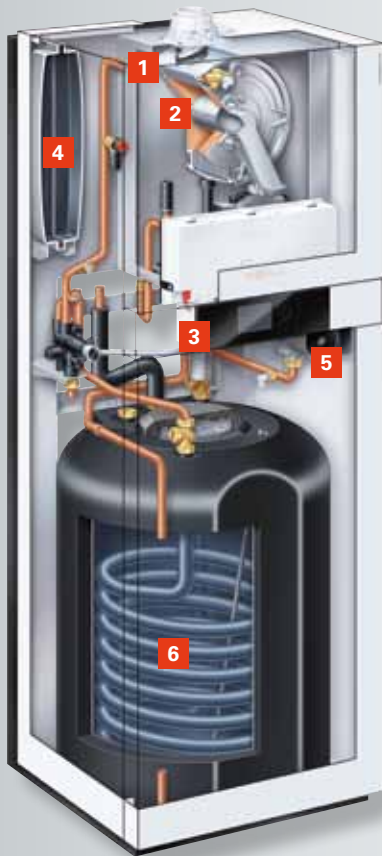
Vitodens 222-F mit emailliertem Rohrwendel-Warmwasserspeicher (Typ B2SA) für Gebiete mit hartem Wasser