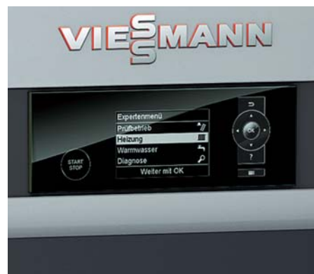
Menügeführte Regelung des Holzvergaserkessels

Mit dem Touchdisplay Vitotrol 350 wird der Holzvergaserkessel auch vom Wohnraum aus bedienbar. Das fünf Zoll große Display im Format 16:9 macht die Bedienung denkbar einfach. Alternativ ist der Austausch des im Kessel integrierten Bedienteiles durch die Touchscreen-Variante möglich.