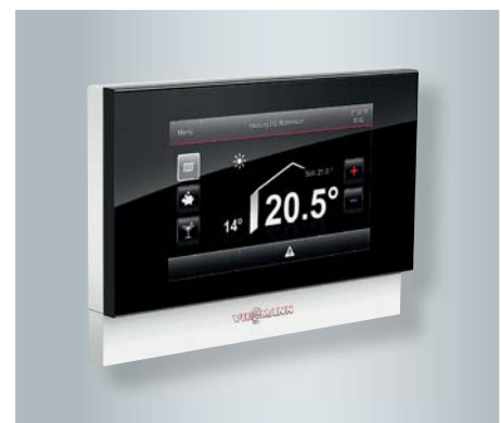
Fernbedienung Vitotrol 350 mit Touchdisplay für den Wohnraum