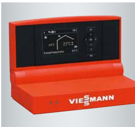
Vitotronic 200 Regelung mit übersichtlicher Menüführung