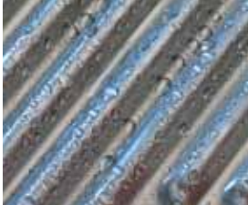
Inox-Crossal-Wärmetauscher aus Edelstahl

Spitzentechnik – dieser Gas-Brennwertkessel lässt keine Wünsche offen.